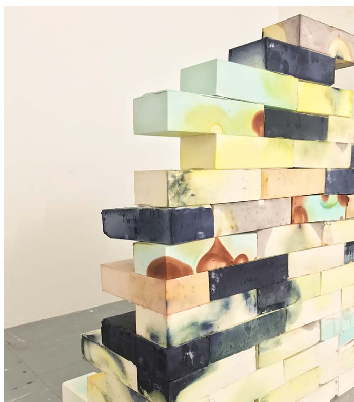
Atavisme, 2019. Plâtre, solutions photo-sensibles, résine, étagère en chêne.