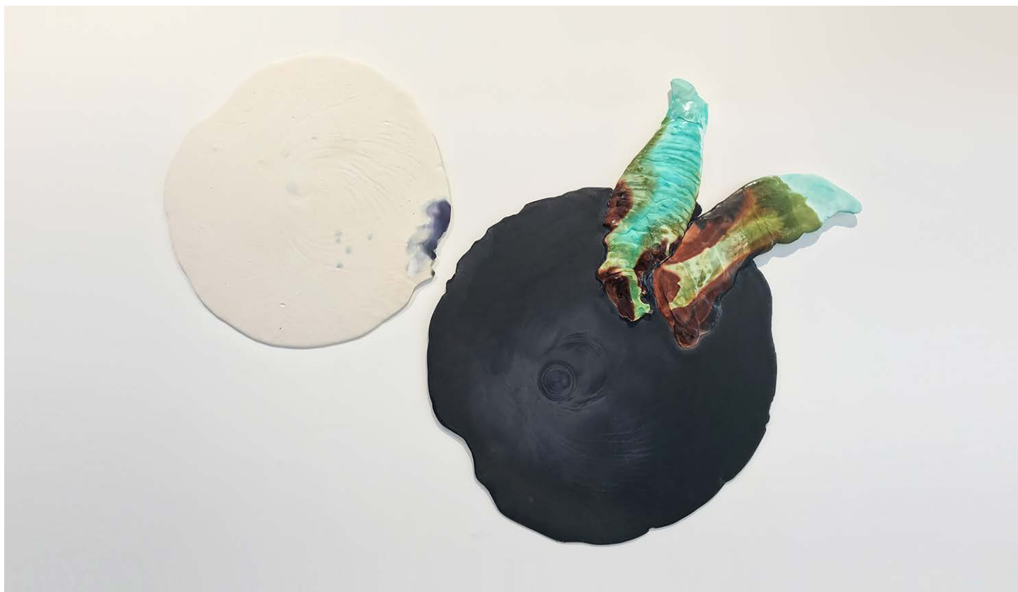
Volupté, 2019. Plâtre, résine et solutions chimiques, 100 x 150 cm.